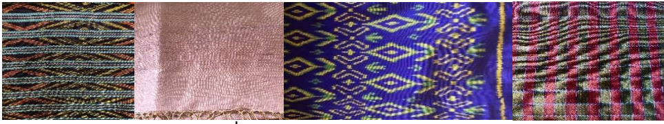
ภาพที่ 3 สํารวจลวดลายของผ้าทออ่างเตย

การประชุมสวนสุนันทาวิชาการระดับชาติ ครั้งที่ 10 การวิจัยเพื่อความยั่งยืน ภายใต้ชีวิตวิถีใหม่ หลังโควิด-19 มหาวิทยาลัยราชภัฏสวนสุนันทา เรื่อง “การท่องเที่ยวเพื่อความยั่งยืนภายใต้ชีวิตวิถีใหม่ หลังโควิด-19”