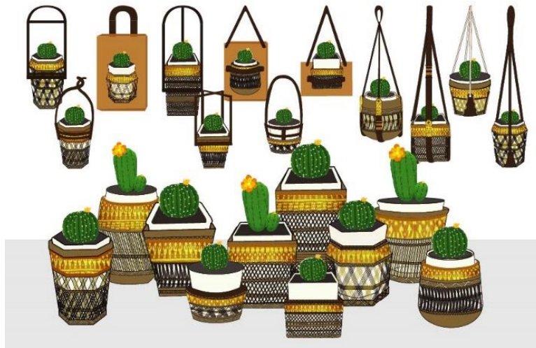
ภาพที่ 4 ผลงานการออกแบบชิ้นแรก

การพัฒนาการสร้างสรรค์ผลงานลวดลายจักสานท้องถิ่น จากผลิตภัณฑ์ที่มีอยู่ ของชุมชนแหลมประดู่ อำเภอบ้านโพธิ์ จังหวัดฉะเชิงเทรา ผู้วิจัยได้หาข้อดี ข้อเสีย ของการออกแบบ การสร้างลวดลายที่ช่วยเสริมแรงให้กระถางต้นไม้มีความคงทน ผสมผสานด้วยผ้าทออ่างเตย ซึ่งเป็นของกลุ่มทอผ้าไหมที่มีคุณภาพและเป็นที่ยอมรับโดยมีตลาดรองรับทั้งในและต่างประเทศ โดยผู้วิจัยได้เลือกใช้ผ้าลายโบราณที่มีแนวเส้นตรง ประดับในผลิตภัณฑ์เพื่อให้เข้ากับรูปแบบของลวดลายการจักสาน ส่งผลให้ผลิตภัณฑ์มีความน่าสนใจและกลมกลืนไปในทิศทางเดียวกันกับรูปแบบการใช้สอย สามารถนำไปจัดวางหลากหลายพื้นที่ จากการวิเคราะห์รูปแบบของการออกแบบผลงานนั้น เป็นรูปแบบที่นิยมในปัจจุบัน ซึ่งจะนิยมรูปแบบของเส้น สี ที่เรียบง่าย และมีโทนสีที่มีความคล้ายคลึงกับสีธรรมชาติ เช่น สีดำ น้ำตาล หรือไม่นิยมย้อมสี เพื่อให้เข้ากับรูปแบบผลิตภัณฑ์ที่มีความนิยมในต่างประเทศ ส่วนใหญ่จะถักกรอบภาชนะ ซึ่งภายในอาจเป็นภาชนะเซรามิกหรือไม้ในรูปทรงไม้ซับซ้อนเพื่อให้ดูทันสมัย ในภาชนะจะมีหลากหลายขนาด นิยมทำเป็นชุดหรือเป็นเซต เป็นผลิตภัณฑ์รูปแบบที่กำลังเป็นที่นิยมในตลาดยุโรปและอเมริกา