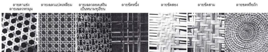
ภาพที่ 2 การศึกษาลวดลายจักรสานในแบบต่างๆ (อ้างอิง :

การศึกษาลวดลายจักสานใน และด้านวัฒนธรรมความเป็นมาและวัตถุดิบในการผลิต ผลิตภัณฑ์จักสานประเภทของแต่งบ้านโดยใช้แนวทางจากการศึกษาลวดลายการสาน ผูก พัน ที่ทำจากตะกร้ากำมะพร้าวของท้องถิ่นร่วมกับผลิตภัณฑ์ท้องถิ่นผ้าทออย่างเตย ประยุกต์เข้ากับรูปแบบผลิตภัณฑ์จักสานประเภทเครื่องใช้ และของแต่งบ้าน ซึ่งผลิตภัณฑ์ที่ผู้วิจัยได้คิดค้นออกแบบนั้นเป็นการจับเอาผลิตภัณฑ์จักสานมาย่อส่วนเพื่อให้มีรูปแบบการใช้งานที่หลากหลายและเข้าถึงกลุ่มลูกค้าวัยรุ่นที่รักการตกแต่งบ้านที่ต้องใช้ชิ้นงานเพื่อตั้งโชว์หรือประดับตกแต่งผนังห้อง โต๊ะ ชั้นวาง เคาะเตอร์ได้ เป็นกระถางต้นไม้ขนาดเล็กได้