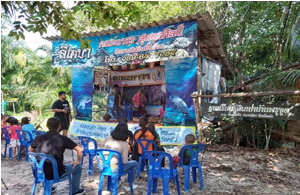
ภาพที่ 1 ภาพบรรยากาศหน้าโรงลิเกป่า

ข้อเสนอแนะในการนำผลวิจัยไปใช้ประโยชน์ 1) สื่อพื้นบ้านลิเกป่า เรื่องท้องถิ่นของเรา สามารถนำไปแสดงเผยแพร่เพื่อเป็นสื่อประชาสัมพันธ์ในลักษณะชุดการแสดงของชุมชนอำเภอเสิงสาง จังหวัดตรังได้ 2) สื่อพื้นบ้านลิเกป่า เรื่องท้องถิ่นของเรา สามารถใช้เป็นสื่อการเรียนรู้ในด้านการศึกษาค้นคว้าข้อมูลชุมชนและการอนุรักษ์การแสดงลิเกป่า 3) ชุดการแสดงสื่อพื้นบ้านลิเกป่า เป็นสื่อบุคคล มีข้อจำกัดในหลายด้านที่สำคัญต่อการทำการแสดงในแต่ละครั้ง ปัจจัยที่มีผลสำคัญคือการจัดสภาพแวดล้อมหน้าโรงลิเก ให้เหมาะสม พร้อมและส่งเสริมการเรียนรู้เพื่อคุณภาพการตอบสนองของผู้เรียน