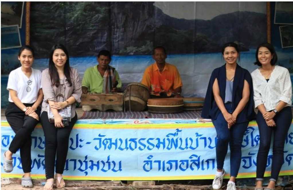
ภาพที่ 3 ภาพคณะผู้วิจัยกับนักแสดงลิเกป่า ขณะเตรียมเครื่องดนตรี ที่มา : ภาพถ่ายโดยนางสาวชญาดา รักรู้ เมื่อวันที่ 6 เดือนกรกฎาคม พ.ศ. 2562