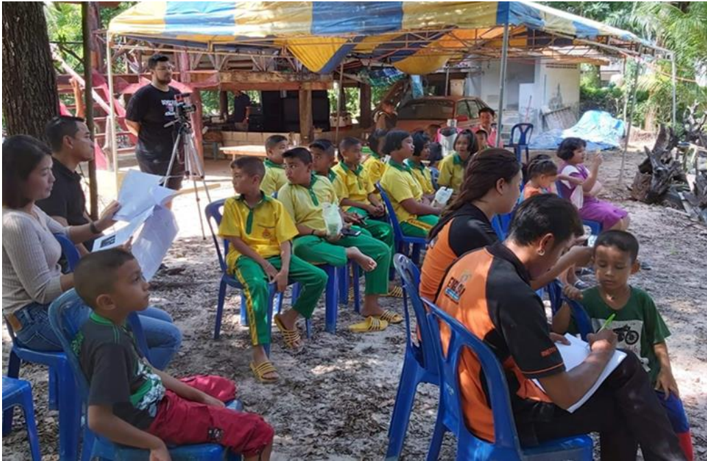
ภาพที่ 2 ภาพบรรยากาศหน้าโรงลิเกป่า มีเยาวชนในชุมชนร่วมชมการแสดง

การประชุมสวนสุนันทาวิชาการระดับชาติ ครั้งที่ 10 การวิจัยเพื่อความยั่งยืน ภายใต้ชีวิตวิถีใหม่ หลังโควิด-19 มหาวิทยาลัยราชภัฏสวนสุนันทา เรื่อง “การท่องเที่ยวเพื่อความยั่งยืนภายใต้ชีวิตวิถีใหม่ หลังโควิด-19”